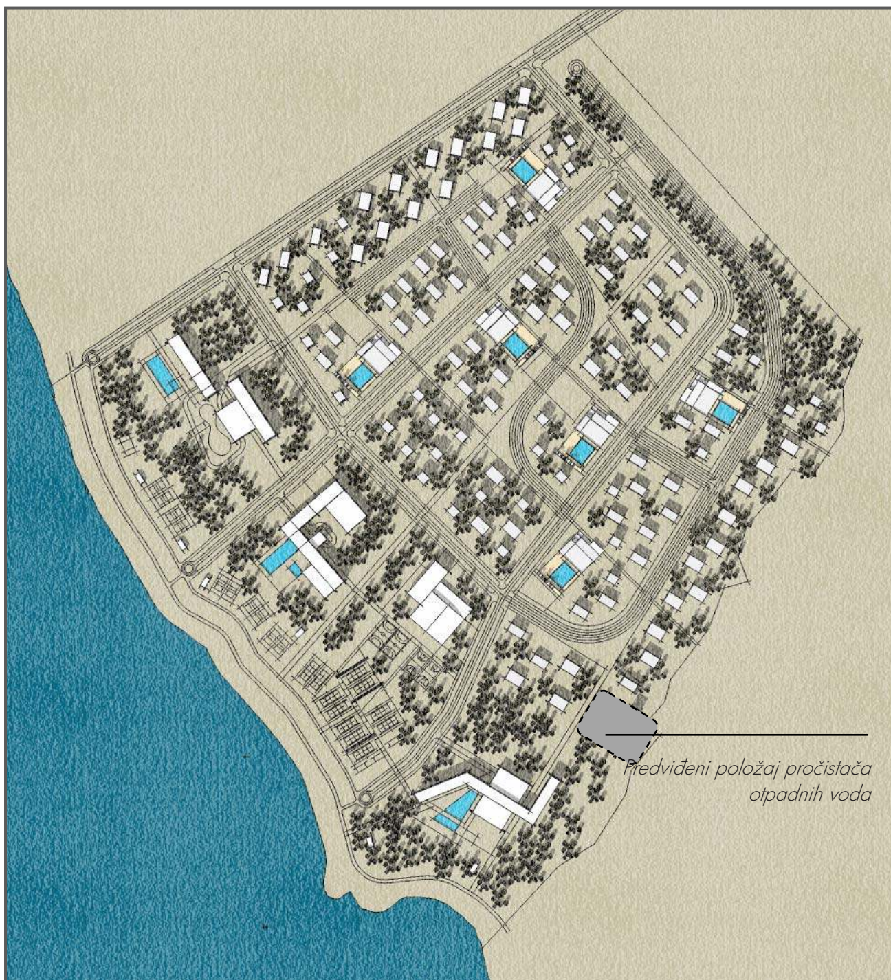
(jedno od mogućih detaljnih rješenja zone)